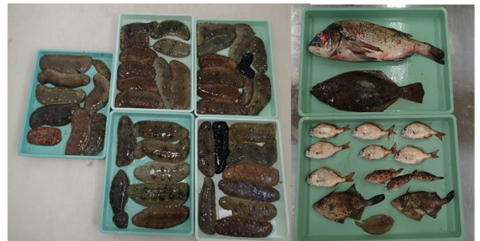
図3 カキ殻区で採捕された魚介類

殻区で多く採捕されました（図3,4）。ナマコの他にもカキ殻区でクロダイ、ヒラメ、マダイ、カサゴ等多くの有用魚種が採捕され、カキ殻敷設の効果が確認されました。今年度、同様の調査を今後3回予定しており、カキ殻敷設の効果をより詳細に明らかにしていきたいと思ひます。