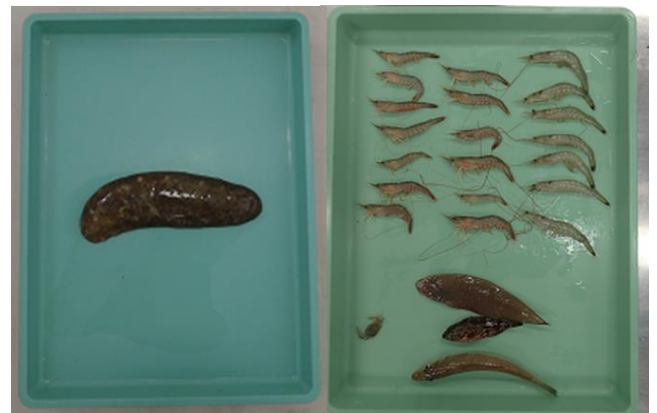
図4 対照区で採捕された魚介類

来年度以降もカキ殻の敷設を予定しており、ナマコ調査をはじめ底質環境、潜水集魚調査等を予定していますので、関係者の皆様にはご協力をよろしくお願ひします。（水圏環境室：古村）