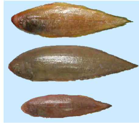
写真1 ウシノシタ類3種（上からイヌノシタ、コウライアカシタビラメ、アカシタビラメ）

ウシノシタ類3種の月別成分組成は、およそ水分79～80%、粗タンパク質18～20%、脂質0.1～0.4%の範囲にあり、水分と粗タンパクに季節変化がみられるが、種間では差がなかった。脂質は極めて少なく、3種の中ではコウライアカシタビラメがやや多かった。一般に魚は季節により脂質含量に差があり、味も異なってくるため美味しい時期の旬のものを選ぶのがよいとされるが、ウシノシタ類の場合は脂質が少なく、他の成分の季節変化も少ないことから漁獲の盛期が、いわゆる旬と考えられた。