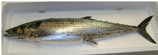
写真1 漁獲されたサワラ

漁業者と行政が手を取り合って取り組んだこのサワラ資源回復は、今では優良事例として他魚種のモデルケースに取り上げられるまでになっている。関係者の努力に感謝しつつ、私もおいしくサワラをいただこうと思う。（資源増殖室：竹本）