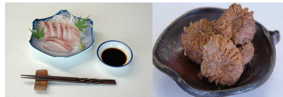
写真2 サワラ料理（左：刺身、右：真子の煮付け）